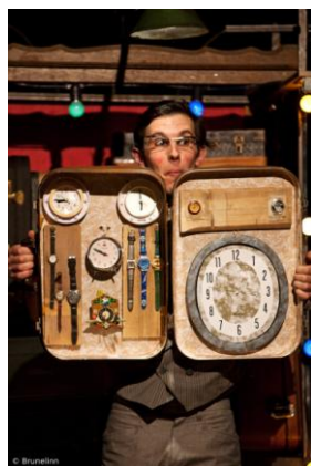
Tous droits réservés.

Ecriture : Yoann Franck, Virginie Haratyk Mise en scène : Mayeul Loisel Jeu : Yoann Franck Musique composée et interprétée par : Marc Clément Lumières : Hervé Roze Durée : 35 minutes