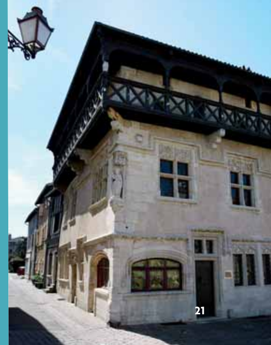
L'hôtel de la Monnaie à Vic-sur-Seille

Die Landschaft des „Pays du Saulnois“, die sich auf einen Teil des Naturparks Lothringen erstreckt, ist – wie schon ihr Name sagt – ein Land des Salzes. Aus den Salzquellen gewann sie ihren Reichtum bis zur Französischen Revolution. Das Kulturerbe von Marsal und Vic-sur-Seille zeugt noch heute von dieser Zeit. Das von der Seille durchflossene Saulnois ist aber auch ein Land der Seen und bietet Gelegenheit, das Moselland einmal von seiner naturbelassenen Seite kennenzulernen, mit seiner geschützten Fauna und Flora, vor allem an den Uferwegen der Domaine de Lindre. Es erfordert einen vertrauteren Zugang, und dem Besucher, der sich die Zeit nimmt, genauer hinzusehen, erschließt sich der authentische Charakter einer Landschaft voller Nuancen, nach der Art der berühmten Hell-Dunkel-Malerei von Georges de La Tour, einem Sohn dieses Landes.